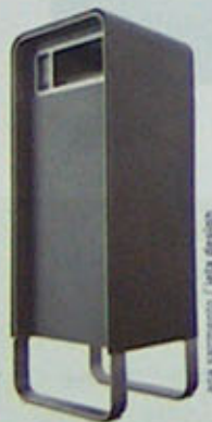
Imagem: Ubos design / ainda

O Des+gn mais*, plano para o design nos sectores produtivos, parte do design como factor de competitividade económica, quer incrementando a competência em design nas empresas portuguesas — através da colocação, formação e monitorização de designers estagiários —, quer promovendo a internacionalização dos seus produtos e marcas. O sentido de oportunidade de esforços conducentes a uma maior cultura do design continua a ser estratégico para Portugal, tanto mais que tem vindo a perder mercado — apesar das facilidades comunitárias europeias — não sendo levantado a sua notoriedade junto dos seus pares, apesar de considerar a recepção turística como indústria de elevado potencial. Mantêm-se urgentes os apelos de Sena da Silva: "Portugal precisa de [mais] design".