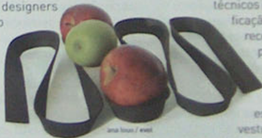
Imagem: Ubos design / ainda

O Des+gn mais*, plano para o design nos sectores produtivos, parte do design como factor de competitividade económica, quer incrementando a competência em design nas empresas portuguesas — através da colocação, formação e monitorização de designers estagiários —, quer promovendo a internacionalização dos seus produtos e marcas. O sentido de oportunidade de esforços conducentes a uma maior cultura do design continua a ser estratégico para Portugal, tanto mais que tem vindo a perder mercado — apesar das facilidades comunitárias europeias — não sendo levantado a sua notoriedade junto dos seus pares, apesar de considerar a recepção turística como indústria de elevado potencial. Mantêm-se urgentes os apelos de Sena da Silva: "Portugal precisa de [mais] design".